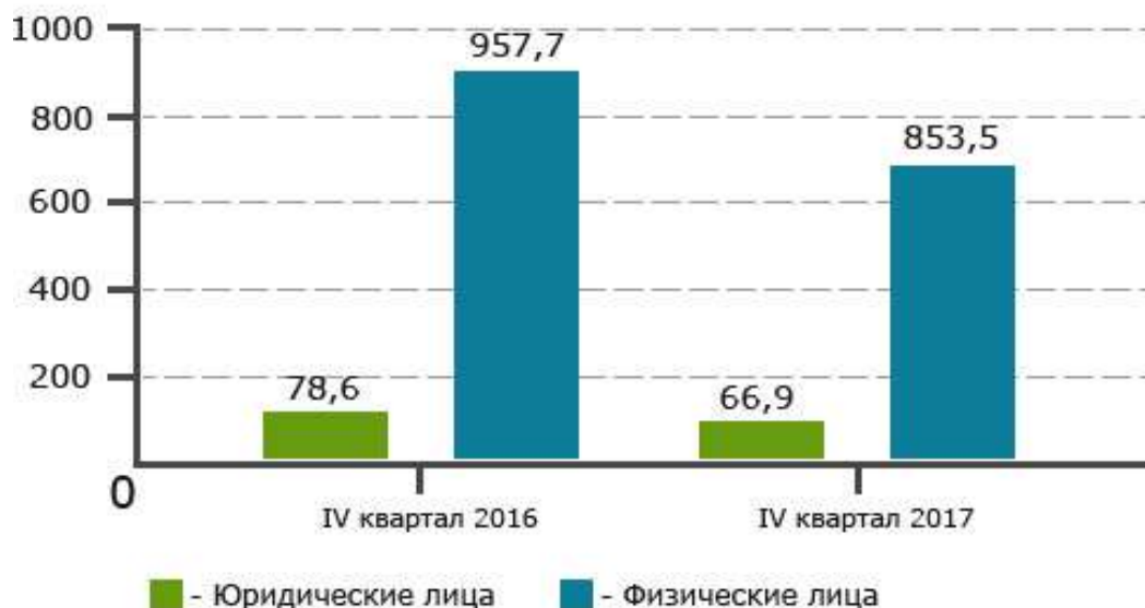
Сопоставительная диаграмма количества счетов депо, обслуживаемых инвестиционными посредниками (номинальными держателями) (тыс.шт.)

Центральный депозитарий ценных бумаг осуществляет учет прав на ценные бумаги, принадлежащие 37 инвестиционным посредникам и его клиентам, путем